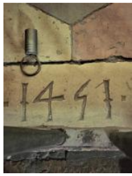
Dettaglio di pavimento a S. Fermo

Come stupirsi nuovamente di un libro già letto? È sufficiente ricominciare da capo cambiando il ritmo e l'accento di attenzione. Come meravigliarsi per una strada fin troppo familiare? Basta soffermarsi e cercare con il proprio sguardo piccole storie indelebili, iscritte dal tempo, da una goccia di pioggia o da una mano. Sono minuzie di un racconto che appartiene alla città, che accarezza e fa parte della nostra quotidianità. Un solco accidentale: l'avvallamento dei gradini di